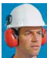
Casque anti bruit