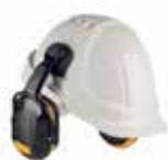
Casque anti bruit