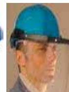
Ecran de protection