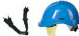
Jugulaires 2 ou 4 pts